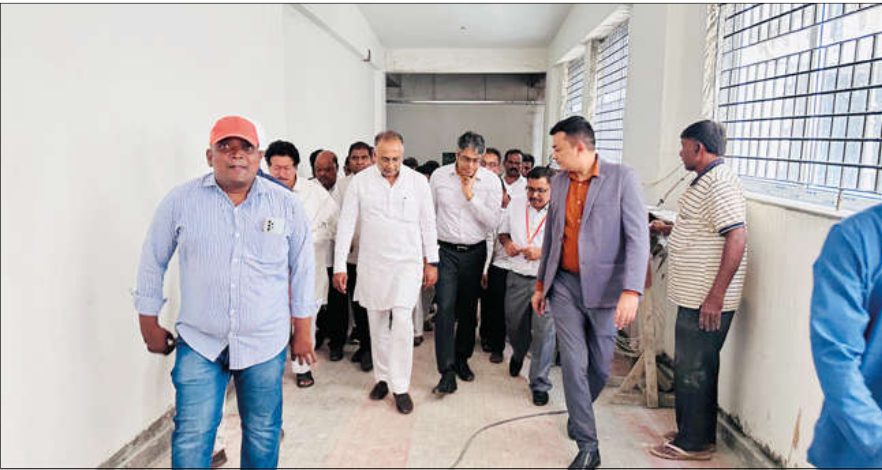
● ವಾರ್ತಾಲೋಕ ವಾರ್ತೆ

ಹೊಸಪೇಟೆ (ವಿಜಯನಗರ) ಅಕ್ಟೋಬರ್ 22 (ಕ.ವಾ): ಆರೋಗ್ಯ ಮತ್ತು ಕುಟುಂಬ ಕಲ್ಯಾಣ ಇಲಾಖೆಯ ಸಚಿವರಾದ ದಿನೇಶ್ ಆರ್. ಗುಂಡೂರಾವ್ ಅವರು ವಿಜಯನಗರ ಹೊಸಪೇಟೆಯಲ್ಲಿ ನಿರ್ಮಾಣವಾಗುತ್ತಿರುವ ಜಿಲ್ಲಾ ಆಸ್ಪತ್ರೆ ಕಟ್ಟಡ ಕಾಮಗಾರಿಯನ್ನು ಅಕ್ಟೋಬರ್ 22 ರಂದು ಶಾಸಕರೊಂದಿಗೆ ಪರಿಶೀಲನೆ ನಡೆಸಿದರು. ನೂತನ ಜಿಲ್ಲೆಯಾದ ನಂತರ ಜಿಲ್ಲಾ ಆಸ್ಪತ್ರೆ ನಿರ್ಮಾಣ ಕಾಮಗಾರಿ ನಡೆಯುತ್ತಿದೆ. ಸುಸಜ್ಜಿತ ಆಸ್ಪತ್ರೆ ಇಲ್ಲದೆ ಅಕ್ಕಪಕ್ಕದ ಜಿಲ್ಲೆಗಳಿಗೆ ಉನ್ನತ ಚಿಕಿತ್ಸೆಗಾಗಿ ತೆರಳಬೇಕಾಗಿದೆ. ಆದಷ್ಟು ಬೇಗ ಜಿಲ್ಲಾಸ್ಪತ್ರೆ 300 ಹಾಸಿಗೆ ಸಾಮರ್ಥ್ಯದ ಜಿಲ್ಲಾ ಆಸ್ಪತ್ರೆ ನಿರ್ಮಾಣದವಾದರೆ ಇಲ್ಲಿಯೇ ತುರ್ತು ಚಿಕಿತ್ಸೆ, ಶಸ್ತ್ರಚಿಕಿತ್ಸೆ ಸೇರಿದಂತೆ ಇತರ ಚಿಕಿತ್ಸೆ ಸಿಗುವುದರಿಂದ ಜನರಿಗೆ ಅನುಕೂಲವಾಗಲಿದೆ. ಸಚಿವರು ನಿರ್ಮಾಣ ಪ್ರಗತಿ ಪರಿಶೀಲಿಸಿದರು. ನಂತರ, ಅಧಿಕಾರಿಗಳೊಂದಿಗೆ ಮಾತನಾಡಿದ