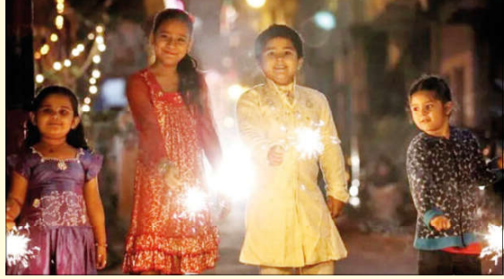
● ವಾರ್ತಾಲೋಕ ವಾರ್ತೆ

ಪಟಾಕಿ ಕಡಿವಾಣ : ಕಾಂಗ್ರೆಸ್ ಸರ್ಕಾರ ಹಿಂದೂಗಳ ಧಾರ್ಮಿಕ ಸ್ವಾತಂತ್ರ್ಯ ಕಸಿದುಕೊಳ್ಳುತ್ತಿದೆ ಎಂದು ಆಕ್ರೋಶ