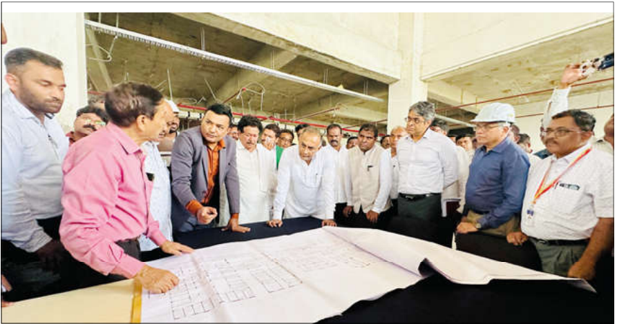
● ವಾರ್ತಾಲೋಕ ವಾರ್ತೆ