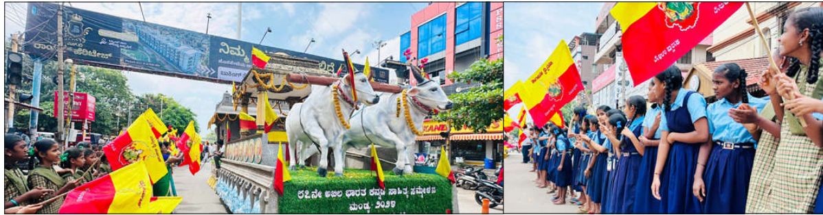
● ವಾರ್ತಾಲೋಕ ವಾರ್ತೆ

ಹೊಸಪೇಟೆ (ವಿಜಯನಗರ) ಅಕ್ಟೋಬರ್ 22 (ಕ.ವಾ): ಅರೋಗ್ಯ ಮತ್ತು ಕುಟುಂಬ ಕಲ್ಯಾಣ ಇಲಾಖೆ ಸಚಿವರಾದ ದಿನೇಶ್ ಆರ್.ಗುಂಡೂರಾವ್ ಅವರು 87 ನೇ ಅಖಿಲ ಭಾರತ ಕನ್ನಡ ಸಾಹಿತ್ಯ ಸಮ್ಮೇಳನದ ಅಂಗವಾಗಿ ಕನ್ನಡ ರಥಯಾತ್ರೆಗೆ ಅಕ್ಟೋಬರ್ 22 ರಂದು ಹೊಸಪೇಟೆ ನಗರದ ವಾಲ್ಮೀಕಿ ವೃತ್ತದಲ್ಲಿ ರಥಕ್ಕೆ ಪುಷ್ಪ ನಮನ ಸಲ್ಲಿಸುವುದರ ಮೂಲಕ ವಿಜಯನಗರ ಜಿಲ್ಲೆಗೆ ಸ್ವಾಗತಿಸಿದರು.