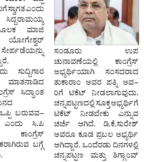
● ವಾರ್ತಾಲೋಕ ವಾರ್ತೆ