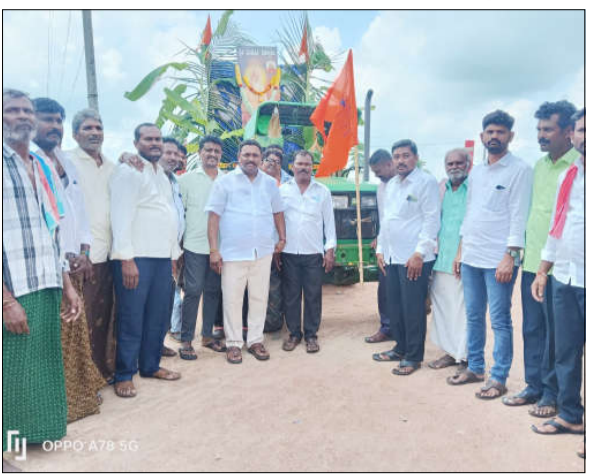
ವಾಲ್ಮೀಕಿ ಭಾವಚಿತ್ರಕ್ಕೆ ಜೆಸಿಬಿ ಮೂಲಕ ಮಾಲಾರ್ಪಣೆ ನೆರವೇರಿಸಿದ್ದು, ಎಶೇಷವಾಗಿತ್ತು. ಮೆರವಣಿಗೆ ನಂತರ ಅನ್ನಸಂಕರಪಣಿ ಕಾರ್ಯಕ್ರಮ ನೆರವೇರಿಸಲಾಯಿತು.

● ವಾರ್ತಾಲೋಕ ವಾರ್ತೆ ಗಂಗಾವತಿ: ಅ 19. ತಾಲ್ಲೂಕಿನ ಶ್ರೀರಾಮನಗರದಲ್ಲಿ ಶನಿವಾರದಂದು ಮಹರ್ಷಿ ವಾಲ್ಮೀಕಿ ಭಾವಚಿತ್ರ ಭವ್ಯ ಮೆರವಣಿಗೆ ಜರುಗಿತು. ವಾಲ್ಮೀಕಿ ಜಯಂತಿ ಪ್ರಯುಕ್ತ ಗ್ರಾಮವು ಸೇರಿದಂತೆ ಸುತ್ತಲಿನ ಗ್ರಾಮಸ್ಥರು ಅಪಾರ ಸಂಖ್ಯೆಯಲ್ಲಿ ಪಾಲ್ಗೊಂಡಿದ್ದರು. ಮೆರವಣಿಗೆಯು ಗ್ರಾಮದ ಶ್ರೀದೇವಿ ಹೋಟೆಲ್ ನಿಂದ ಪುನೀತ್ ಸರ್ಕಲ್ ಮೂಲಕ ವಾಲ್ಮೀಕಿ ವೃತ್ತದವರೆಗೆ ನೆರವೇರಿಸಲಾಯಿತು. ಶೋಭಾಕುಂಭ ಹೊತ್ತ ಮಹಿಳೆಯರು ಮೆರವಣಿಗೆಗೆ ಮೆರಗು ತಂದರು. ಡಿಜೆ ಪಾಡುಗಳಿಗೆ ಯುವಕರು ಕುಣಿದು ಕುಪ್ಪಳಿಸಿದರು.