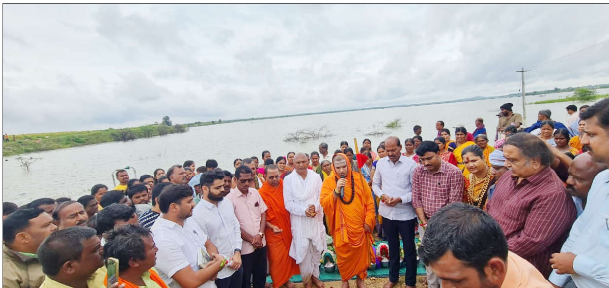
● ವಾರ್ತಾಲೋಕ ವಾರ್ತೆ